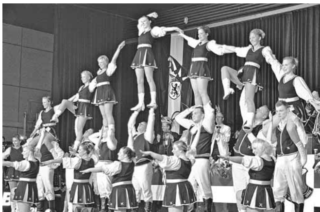
Die „Hoppekrötsch“ begeisterten mit akrobatischen Tänzen.