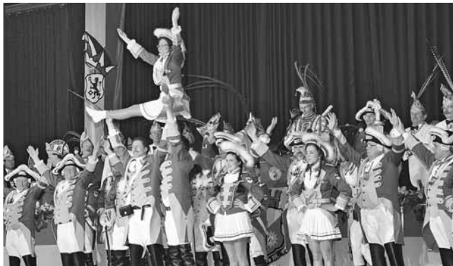
Die KG Narrengarde Dürwiß feiert in dieser Session ihr 75jähriges Bestehen.